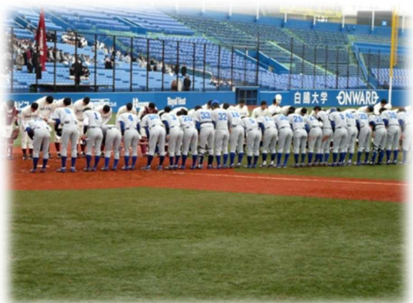
↑対早稲田 3-3 で引き分けた。(4/10)