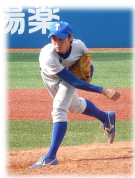
↑ 好投を見せた1年初馬投手

ることが出来ず0勝、悔しいシーズンとなりました。一方、下級生投手の好投が光り、来季以降の飛躍が期待できる結果となりました。