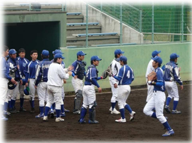
↓名城大とのオープン戦の様子

宮崎合宿がありました。その間に東日本大震災 が起こり、活動の停止、あるいはオープン戦の中止 など様々な面で影響が出ましたが、そんな状況のな かでも野球を続けていけるありがたさを改めて実感 する機会となりました。