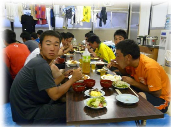
宿舎でご飯を食べる選手たち

最後になりましたが、合宿期間中にはヨーロッパ関係者の皆様、差し入れを頂いたOBの方々、その他大勢の方々に大変お世話になりました。この場を借りて心からお礼申し上げます。本当にありがとうございました。