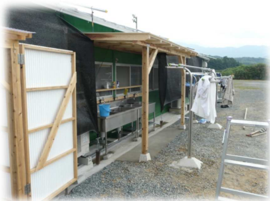
のびのびとした宿舎

1・2年生中心のBチームは8/8〜8/20の約2週間、福岡県糸島市で合宿を実施しました。東大野球部がこの地で合宿を行うのは初めてのことで、球場は九州の大手パン会社「リョーユーパン」が所有するグラウンド、宿舎は球場と同じ敷地内にある小屋をお借りしました。室内練習場や照明設備など設備面は非常に充実していました。また、山々に囲まれた自然豊かなこの球場は周りにお店が全くなく、最も近いコンビニまで約3キロという合宿には理想的な(?)環境です。