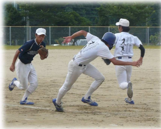
挟殺プレーの練習をする選手

オープン戦も3試合実施しました。久々の試合に緊張している選手もあり、日ごろの練習とは違ったものを感じているようでした。結果は惨敗でしたが、貴重な実戦経験の場となりました。