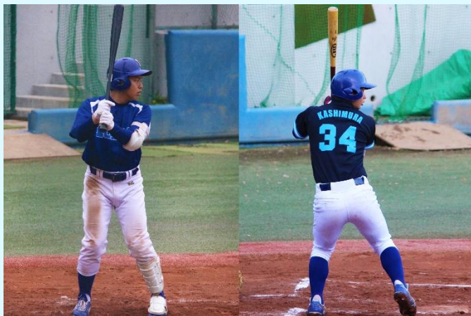
(左)大鳥外野手、(右)檜村内野手